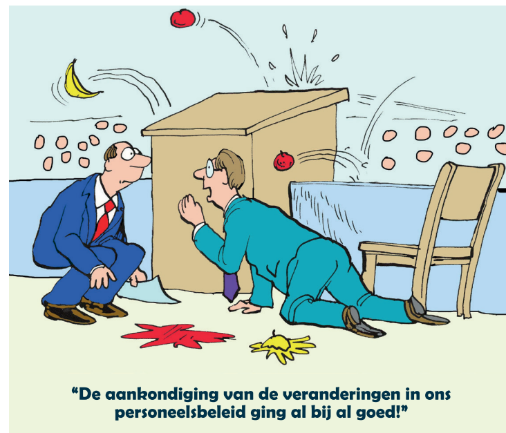
"De aankondiging van de veranderingen in ons personeelsbeleid ging al bij al goed!"

Kortom, investeren in personeelsbeleid is essentieel voor bedrijven die streven naar groei, concurrentievoordeel en duurzaam succes. Door te investeren in mensen leggen bedrijven een solide basis voor toekomstige groei en bouwen veerkracht op in een steeds veranderende zakelijke omgeving.